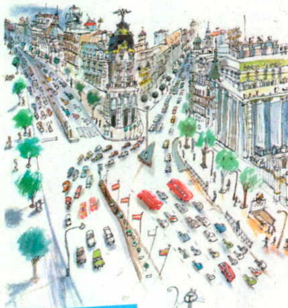
Javier Zabala recoge en sus ilustraciones las calles y plazas más representativas de Madrid